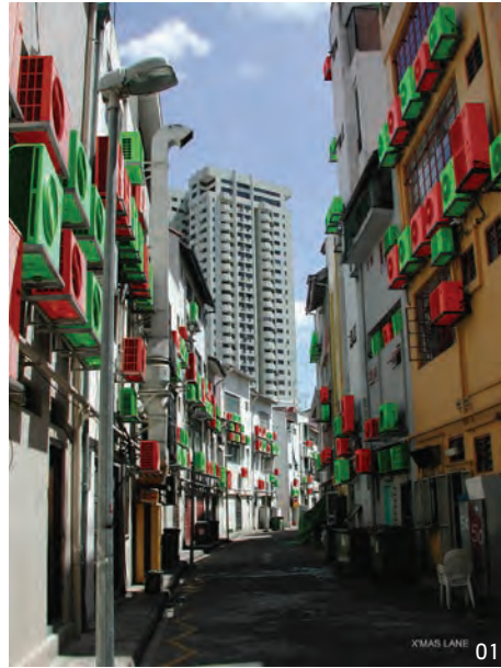
01 ac façade แสดงให้เห็นว่าองค์ประกอบเล็กๆ เหล่านี้สามารถทำหน้าที่ได้ไม่ต่างจากภาพวาดที่สร้างสีสันบนพื้นผิวสถาปัตยกรรม

With the collection and its import seeming to grow in tandem, what’s next for ac façade? “Our next move is to step back and look at our archives again on a broader perspective, perhaps on an urban scale.” And where can the ac façade team likely be found? In “the narrow streets filled with humming noises and generated hot air ... trying to understand repercussions and to discover the potentials of these little metal boxes...”