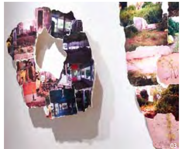
01 วัตถุที่ Eiji พบในไซต์ก่อสร้างถูกเก็บสะสมและนำมาจัดวางร่วมกันเป็นผลงานศิลปะที่มีทั้งคอนกรีต ไม้ ปิ๊บ และอุปกรณ์ก่อสร้างอื่นๆ 02 ภาพวาดที่ได้แรงบันดาลใจมาจากการไปพบกบที่ร่องรอยที่มักพบในงานก่อสร้างอาคาร 03 ภาพที่ศิลปินไปถ่ายจากไซต์ก่อสร้างถูกนำมาฝึกและปะติดปะต่อเข้าด้วยกัน 04 งาน interactive installation ประกอบรวมขึ้นเป็นแสงสี เสียง ซึ่งได้ Miklas Moller มาช่วยออกแบบเสียงให้กับนิทรรศการครั้งนี้โดยเฉพาะ